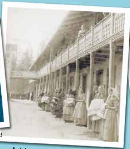
Badedamene ved badeanlegget i 1880-årene