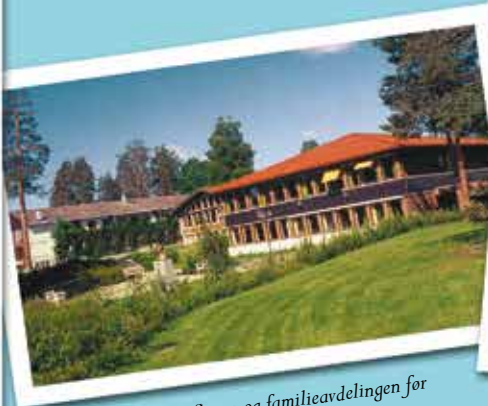
Den gamle A-flooy og familieavdelingen for ombygningen i 1994