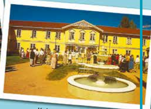
Modum Bad, hovedbygningen i dag