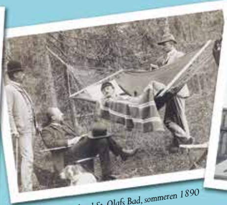
Svenske Prins Carl ved St. Olavs Bad, sommeren 1890