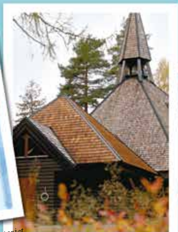
Olavskirken bygges i 1975 og utvides i 2004