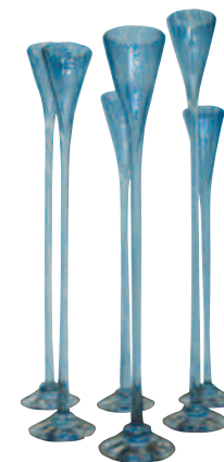
Magnus store iderikdom gjenspeiles i alt han gjør.

Medlem av NK (Norske Kunsthåndverkere) siden 2002