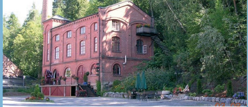
Haugiani Glass holder til i Shoddyhuset som ligger i idylliske omgivelser i Fredfoss kulturpark.